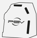
Capot de sécurité